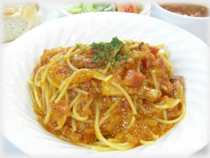
「ナポリタンスパゲッティ」