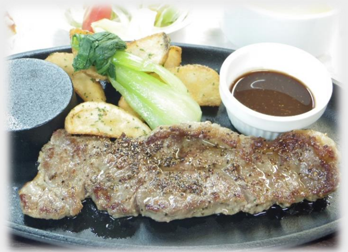
「サーロインステーキセット 150g」