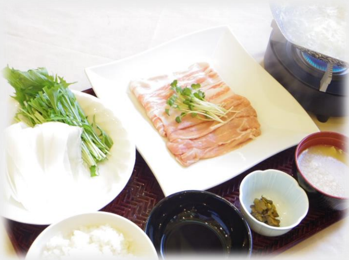
「豚肉のしゃぶしゃぶ」 恋する豚研究所のお肉を使用しています