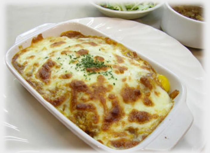
「キーマカレーと玉子のドリア」