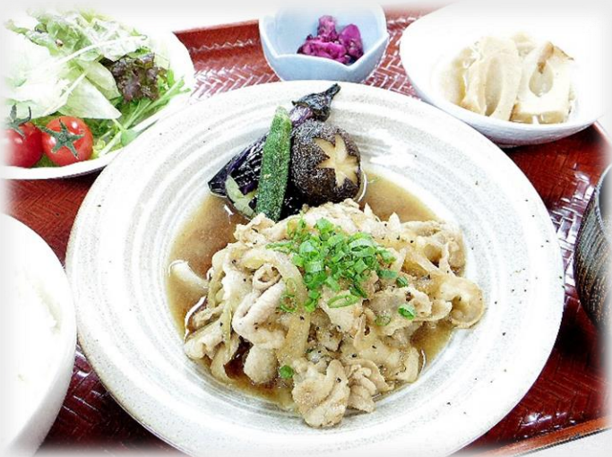
「豚肉の生姜焼き」 恋する豚研究所のお肉を使用しています